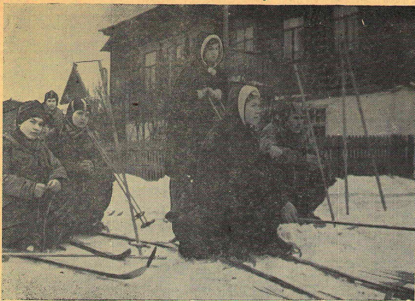
ТУРИСТЫ НА ПРИВАЛЕ.