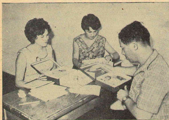
Плоды рук своих, вызывающие гордость.

Ведь всю зиму мы занимались в основном только лыжами.