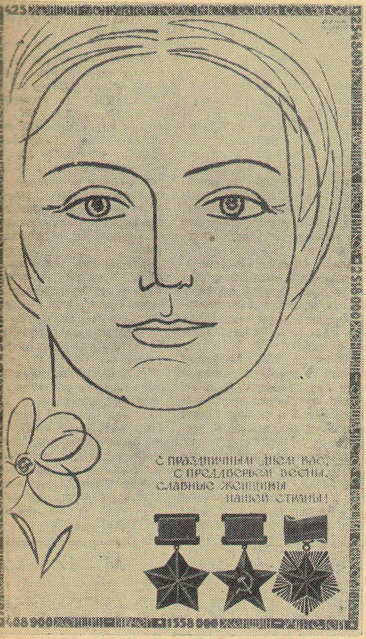
С ПРАЗДНИЧНЫМ ЛЕСОМ ВАС, СПРЯТАВШИХСЯ ПОСРЕДИ СЛАВНЫХ ЖЕНЩИН НАШЕЙ СТРАНЫ!

От редакции. Эта заметка носит коллективный характер. В создании ее принимали участие сотрудники кафедры и студенты.