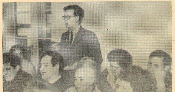
— А нельзя ли английский сделать заочным? — жгучая проблема.

Руководители нескольких роно в один голос спрашивают, до каких пор преподаватели биологии, презирающие в школы, не будут уметь работать на пришкольном участке? Школа в селе объединяет не просто учащихся, но и членов ученических производственных бригад. — К сожалению, вы-