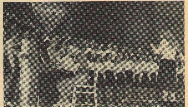
Поет хор естественно-географического факультета.