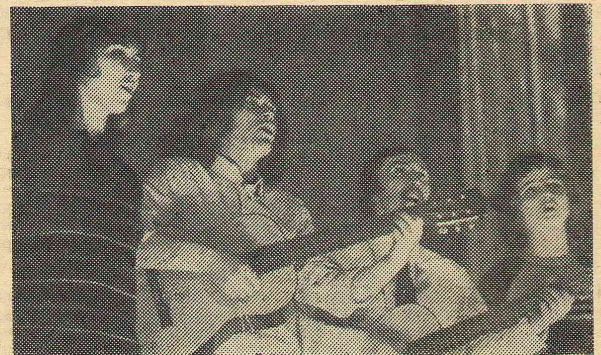
На сцене ансамбль английского отделения иняза.