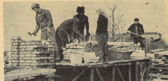
Будет столовая и общежитие.

От улыбок, шуток, дружной работы ярким и праздничным был этот день!