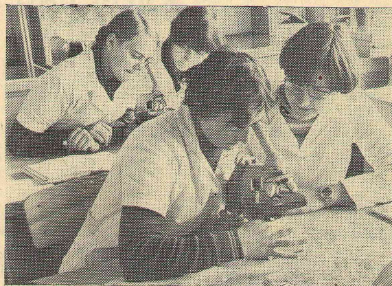
Студенты естественно-географического факультета на занятиях.