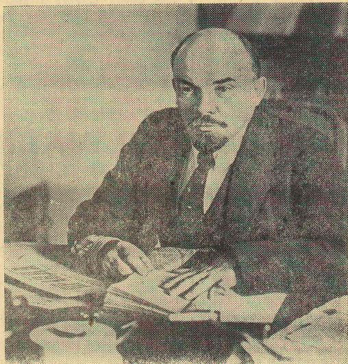
В. И. Ленин в своем кабинете в Кремле. Москва, октябрь 1918 г.

По плану Западно-Сибирского книжного издательства на предстоящее пятилетие развития народного хозяйства СССР есть возможность издать книги о природе сибирских областей. Такую книгу на 15 печатных листов «Природа Омской области» задумали подготовить к печати и омиачи коллективом ученых. Часть рукописей для этого уже собрана. Более 30 авторов принимают участие в подготовке этой книги из разных вузов и НИИ Омска, кто заинтересован в выходе в свет этого первого у нас издания в таком масштабе для широкого