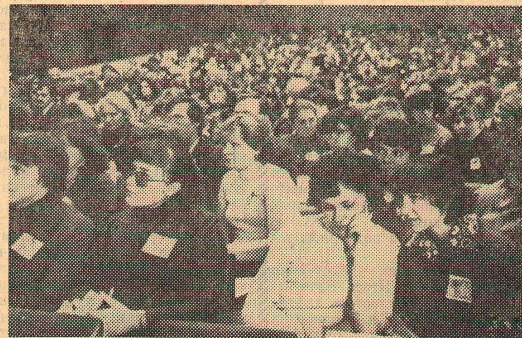
Президиум и зал конференции.