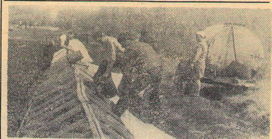
Работа на парниках. Полив рассады. Красногорская СШ. Полтавский район.