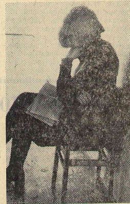
Редактор Д. В. ЗАВИША.