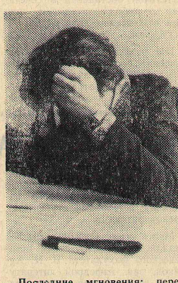
Последние мгновения: перед ответом; перед дверью аудитории, где ты сейчас возьмешь билет.