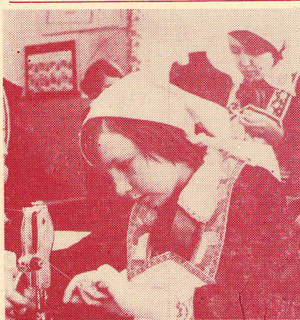
Сошьа я платье бабушке

Мы кос не носили, не знали помад, В пилотках ходили — солдат как солдат. И все же мужчины, как будто приказ, Сестренками, дочками звали всех нас.