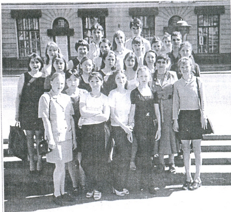
На фото: третьекурсники филфака на социокультурной практике (г. Омск, Музей изобразительных искусств им. М.А.Врубелья, май 2001 г.).