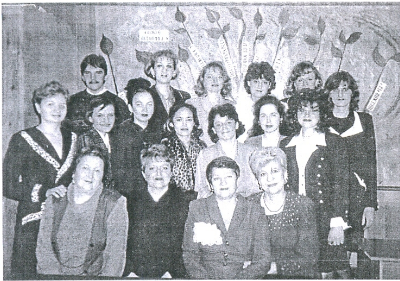
На фото: первый вечер встречи на филфаке (апрель 1998 г.).